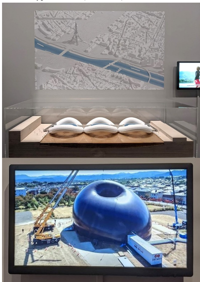
Photographies de l'exposition (M. Drozd et N. Roseau).

On peut regretter que l'exposition n'ait pu se faire le lieu d'une expérimentation in vivo des structures gonflables, comme le proposaient les manifestations évoquées dans le parcours. Ces performances immersives marquent l'ère du gonflable et le partage d'une expérience esthétique. C'est à ces expériences qu'invitait Tomás Saraceno dans les expositions, à Londres, Berlin et Copenhague, de ses Air-Port-Cities , des bulles suspendues, plus ou moins vastes et transparentes, gonflées à l'air et chauffées par la seule énergie solaire. Ses filiations utopiques s'enracinent dans le moment retracé par Aerodream . Absent de la sélection proposée, Saraceno est sans doute, avec son entreprise Aerocene et ses propositions concrètes, l'un des héritiers les plus accomplis de cette idée d'une alternative critique qui aspire à renouer avec les songes de l'air pour imaginer un habitat de la biosphère (Urlberger 2013).