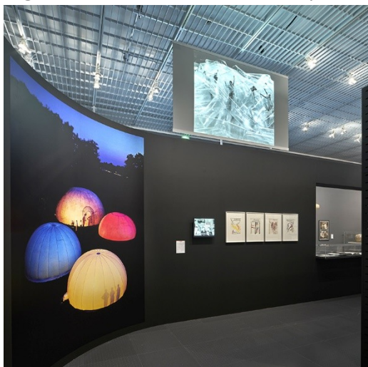
Figure 4. Air Houses de Frank Lloyd Wright (1956)

© Centre Pompidou-Metz. Photo : Didier Boy de la Tour, 2021. Exposition Aerodream .