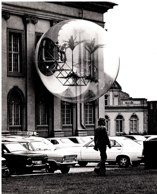
Figure 3. Un exemple d'installation du groupe viennois Haus-Rucker-Co : Oase Nr.7 , Documenta 5 (Kassel, 1972)

Jungman, Antoine Stinco et le groupe Utopie, Yukata Murata et Taneo Oki, Christo et Jeanne-Claude, Ant Farm, Haus-Rucker-Co, le groupe UFO, Quasar. Ces figures prennent place dans un contexte à la fois bouillonnant et désenchanté, où la dislocation des villes, la monotonie des banlieues, la pollution de l'environnement sont le résultat d'un urbanisme spéculatif et d'un consumérisme aliénant.