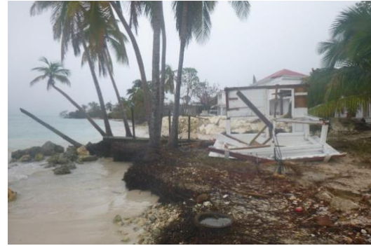
Fig. 2 : Gauche : Endommagement de la route littorale entre Vieux Fort et Basse-Terre (Guadeloupe) suite au passage de Maria. Droite : Bungalow en ruine à Grand-Bourg (Guadeloupe) suite au passage de Maria.