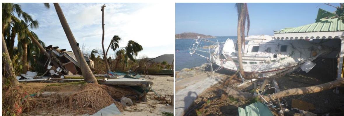
Fig. 1 : Gauche : Ruine d'une construction en première ligne du littoral suite au passage d'Irma dans la baie de Saint-Jean (Saint-Martin). Droite : Habitation détruite par l'échouage d'un bateau au passage d'Irma à Cul de Sac (Saint-Martin).

Le 19 septembre, l'œil du cyclone Maria est passé à quelques kilomètres au sud de l'archipel de la Guadeloupe et a surpris par son intensification explosive avec un quasi doublement de l'intensité des vents en 24 heures, induisant des rafales supérieures à 215 km/h sur l'archipel de la Guadeloupe (Météo-France, 2017b). Les houles très énergétiques (creux de 8m au pic) conjuguées à une surcote importante (estimée à 50-70cm au marégraphe de Pointe-à-Pitre) ont engendré des submersions marines sur les rivages de Marie-Galante, des Saintes, du sud de Basse-Terre et à l'intérieur du Petit Cul-de-Sac marin (rade de Pointe-à-Pitre, zone de Moudong, Petit bourg). La laisse de mer, matérialisée par des débris végétaux ou anthropiques et du sable, a atteint entre 70 et 100 m de distance dans les terres sur ces secteurs. Les dommages sur le bâti en zone littorale liés à l'impact direct des vagues et au sous-cavage des fondations ont été considérables. Sur de nombreux sites, des aménagements littoraux tels que les carbet, les bancs et les routes (notamment la route départementale RD6) ont été affouillés et parfois basculés (Legendre et Guillen, 2017) (cf. Fig. 1 et 2).