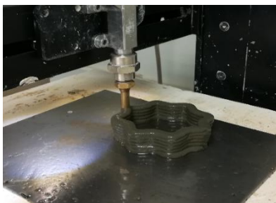
En cours d'impression

Une autre caractéristique très importante pour estimer le temps de l'impression de béton est celle du temps de prise. Pour cela, nous avons déterminé le temps de prise pour BFUP 3 à partir de l'aiguille de Vicat. Nous avons réussi à imprimer avec la formulation du BFUP3 diverses géométries comme le cône octogonal, le cube creux et le vase qui sont illustrés dans la figure 2. Pour imprimer nous avons fait varier la vitesse d'impression entre 6 et 24 mm/s et le débit d'écoulement du matériau entre 452 et 905 mm 3 /s.