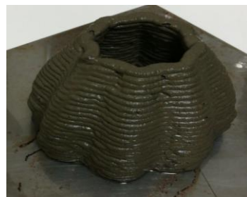
Le cône octogonal (d=8cm ; h=5cm ; temps=21 minutes)