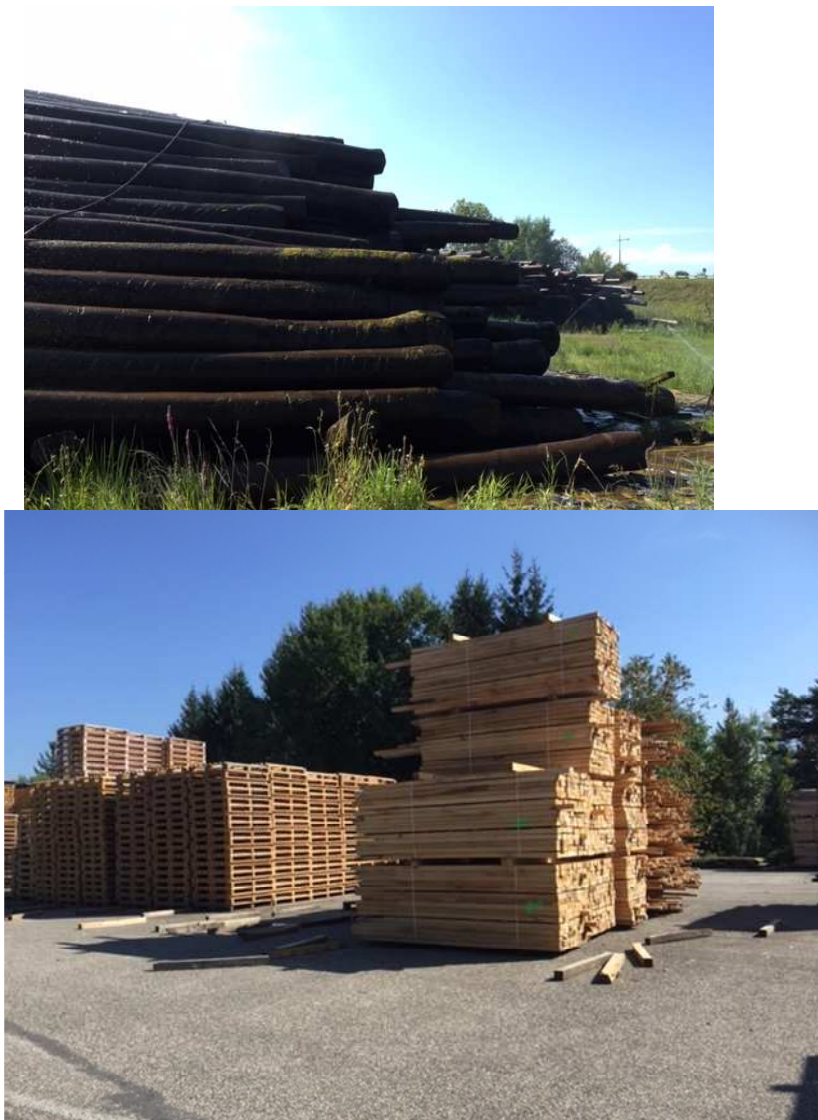
Figure 2. Photographies de bois travaillés dans une scierie du PNR des Vosges (Gobert, août, 2017)

La forêt des Vosges du Nord constitue un écosystème riche qui présentent plusieurs fonctionnalités pour les acteurs du territoire (ou services écosystémiques) (Vallauri, 2005) : récréativité, préservation de la biodiversité, production de bois... Pour autant entre le bois produit, son cycle de transformations et son utilisation notamment en construction, il n'existe pas de continuité sur le territoire. Le bois voyage selon les opportunités du marché (Europe, Asie...) et il n'existe pas nécessairement de lien entre le bois extrait des forêts du PNR, les scieries et les charpentiers, menuisiers et constructeurs. L'enjeu au travers de différents projets ci-dessous présentés est d'inverser cette tendance et de reterritorialiser le cycle de vie du bois.