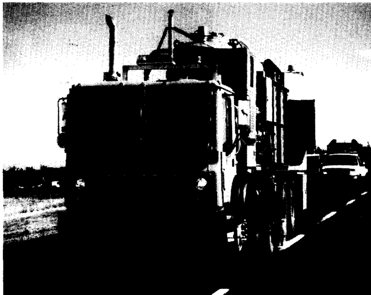
Véhicule de marquage au sol en action.

Le premier « zoom » concerne la place des acteurs de la sécurité routière et la répartition de leurs compétences officielles ; on peut illustrer certaines variations à ce sujet à partir des articles concernant le Québec et l'Allemagne. D'un côté, la place tenue par l'assurance (les missions que doit assurer la Société de l'assurance