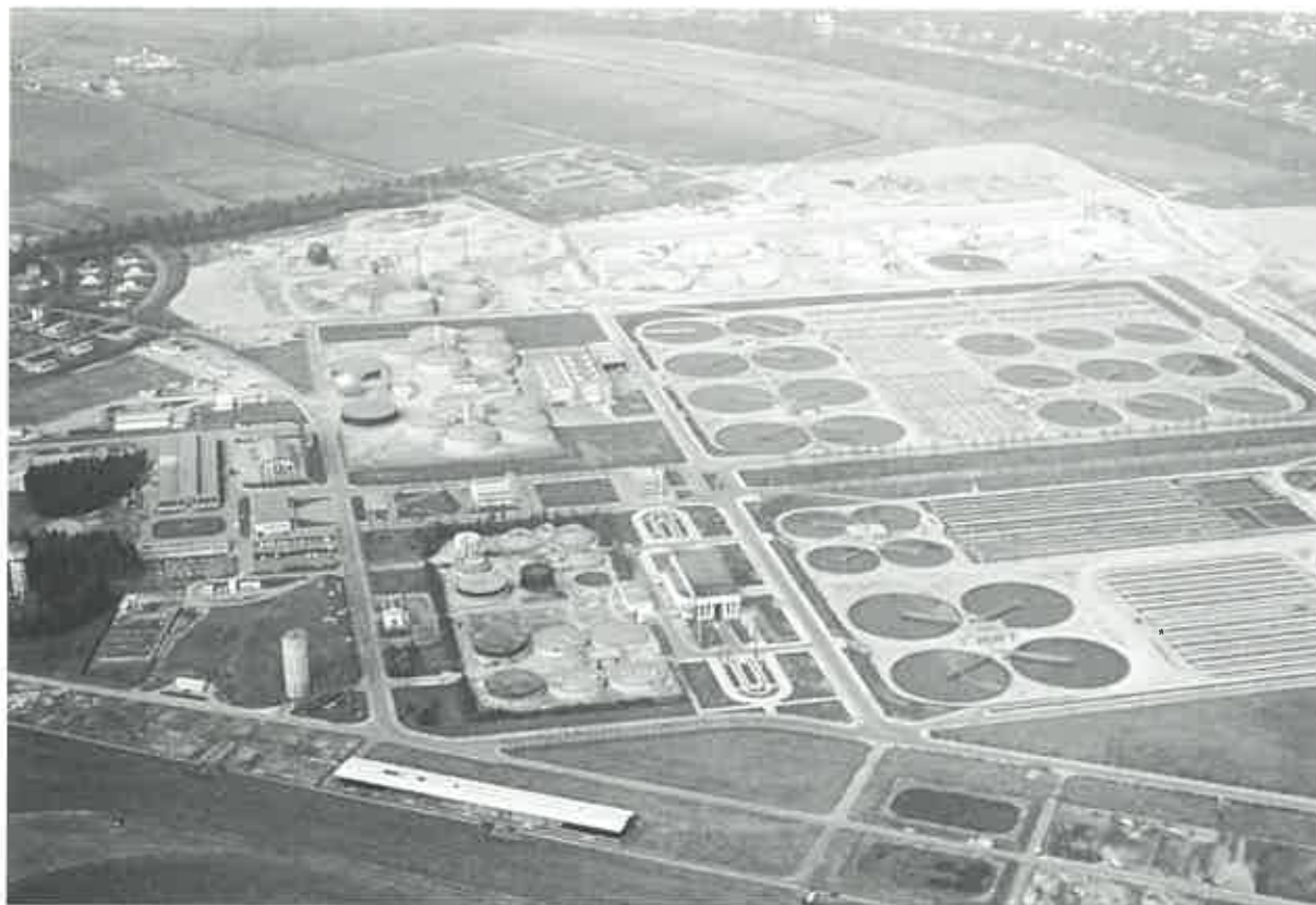
La station d'épuration d'Achères (Yvelines). DREIFIGauthier

l'activité de ces divers spécialistes de l'Ancien Régime.