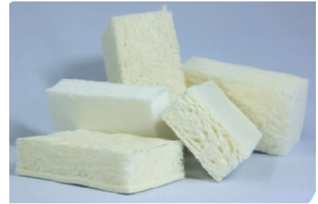
Figure 5 : Blocs de mousses de cellulose thermo isolants

Les mesures des propriétés mécaniques et thermiques permettent d'identifier les interactions entre les composants et d'optimiser leurs proportions pour améliorer les performances.