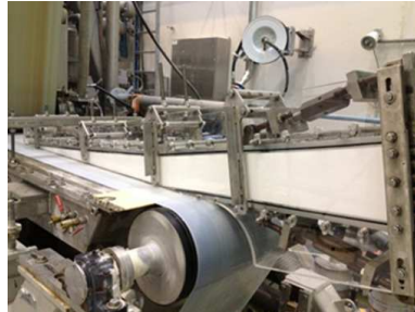
Figure 4 : Fabrication sur la caisse de tête d'une machine pilote