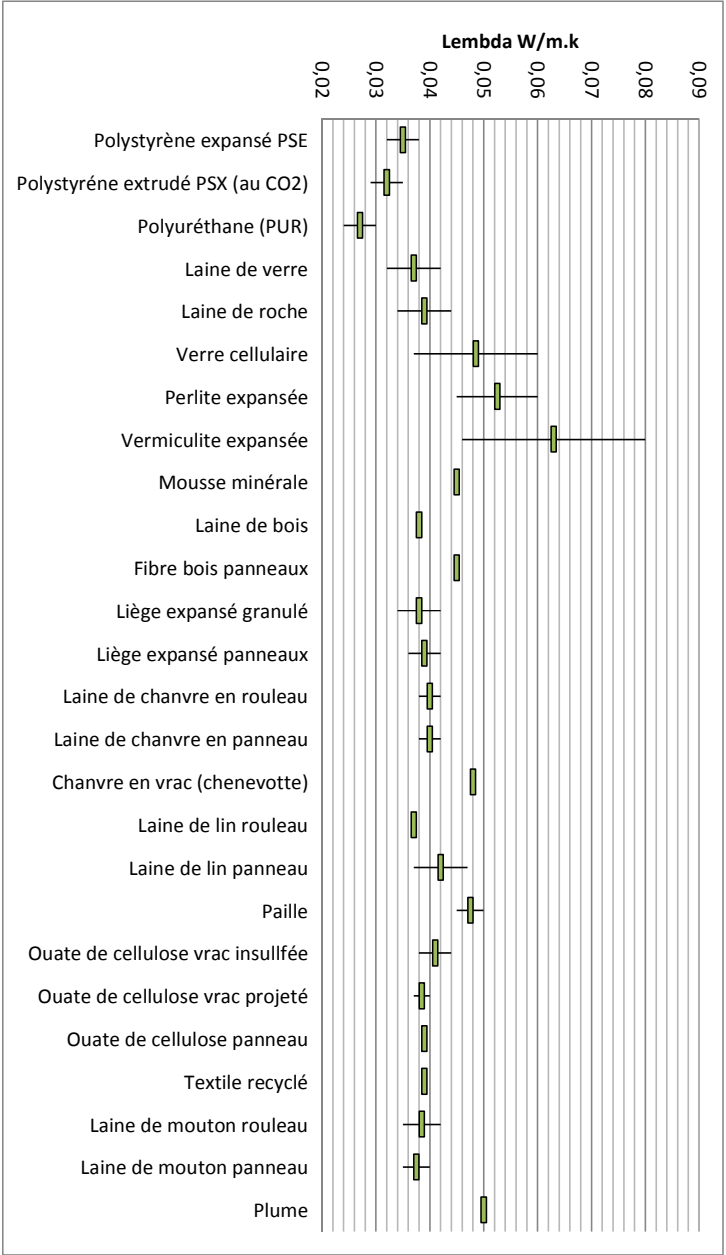
Figure 2 : Conductivités thermiques des matériaux isolants classés par familles