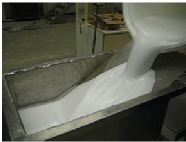
Figure 3 : Fabrication au laboratoire

Les figures 3 à 5 présentent les produits obtenus.