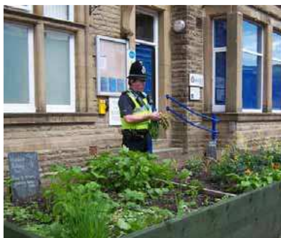
Figure 3. Colonisation alimentaire des espaces en ville à Todmorden (Angleterre). Source Carrot City.

Enfin, des formes innovantes de « colonisation alimentaire » des espaces verts urbains se font jour notamment en Europe, dans la lignée du mouvement des « Incredible Edible » (Incroyables comestibles) qui a vu le jour ces dernières années à Todmorden (Angleterre) : le principe consiste à planter tout végétal qui peut se manger, en libre service, dans tous les interstices verts urbains, des pieds d'arbres aux plates-bandes des édifices publics, en passant par l'éventuel désasphaltage de trottoirs (Figure 3).