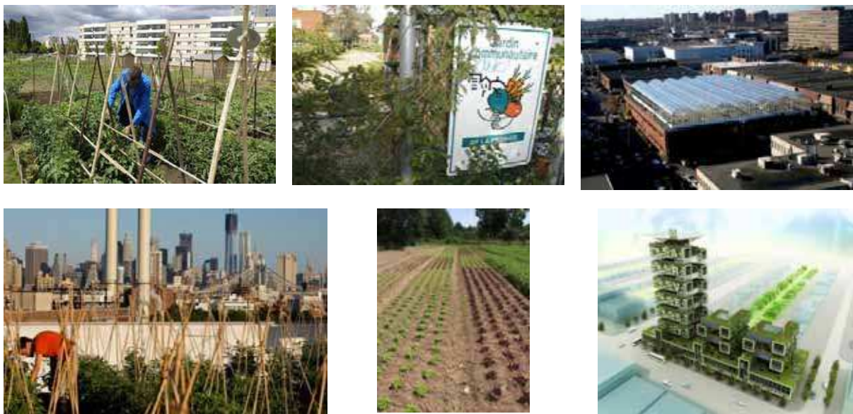
Figure 2. Exemples d'agriculture urbaines en pays du nord. De gauche à droite et de haut en bas : (a) jardin associatif aux Mureaux (78), (b) jardin communautaire à Montréal (clichés J Pourias), (c) la Lufa Farm à Montréal ( www.lufa.org ), (d) ferme sur les toits à New York (in New York Times 12/7/12), (e) Maraîchage périurbain près de Paris (cliché J Pourias), (f) projet de ferme verticale (Romses Architectes, VHYB La ville Hybride©).

Les « fermes verticales » intégrées en milieu urbain, immeubles de production agricole voire aussi aquacole ou d'élevages hors sol, fortement défendues par certains courants aux États-Unis (Despommiers, 2010) sont encore pour la plupart sous forme de projets de designers, mais il est fort probable que des réalisations concrètes voient le jour prochainement dans les pays européens.