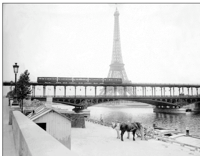
Il ponte di Bir-Hakeim e la Tour Eiffel a Parigi (1908)

PARIGI. Curata da Jean-Marie Duthilleul (Arep-Snfc), architetto di molte delle stazioni del Tgv francese e recentemente partner di Jean Nouvel e Michel Cantal-Dupart per la consultazione internazionale del Grand Paris, e da Marcel Bajard, autore di De la gare à la ville (2007), la mostra «Circular. Quand nos mouvements façonnent les villes» esplora la relazione tra l'evoluzione delle tecniche e delle pratiche di trasporto e la forma urbana, attraverso 9 sezioni che propongono un percorso allo stesso tempo cronologico e tematico. Uno degli aspetti più riusciti consiste nell'esperienza sonora concepita da Louis Dandrel e Bernard Lubat, che immerge il visitatore da un paesaggio sonoro all'altro durante il percorso. Dopo alcune brevi, e a dire il vero un po' rudimentali e non sempre convincenti, considerazioni storiche, dal neolitico al barocco, la mostra comincia con l'immersione sensoriale in una strada del Medioevo. Viene poi il tempo dei trasporti meccanizzati e l'irruzione del treno nel cuore delle città: la stazione, vista come nuova porta urba-